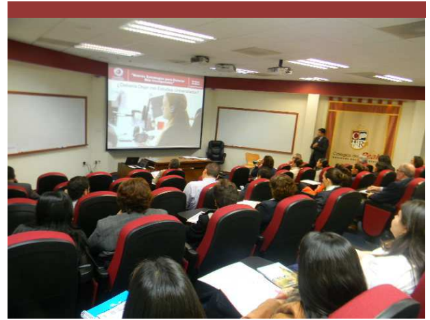
Capacitación Colegio del Real. SLP, México