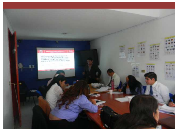
Consultoría Instituto Follow Me, Cuernavaca, México