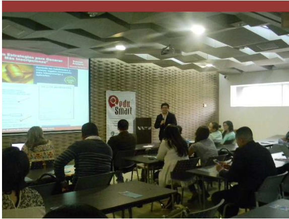
Conferencia Medellín, Colombia.