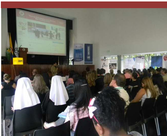
Congreso de Marketing Educativo, Colombia