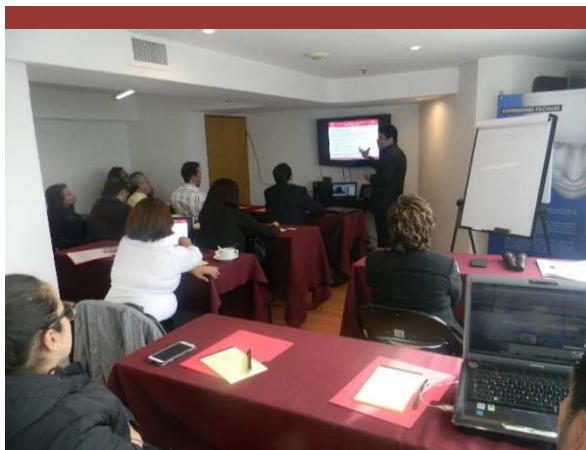
Seminario en Edificio WTC, México DF