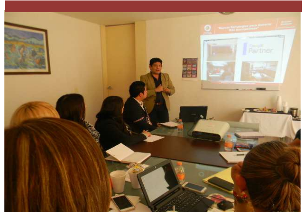
Consultoría Universidad Europea, México DF.